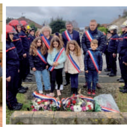
◆ Mars 2023 - Commémoration du 19 mars.