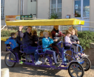
♦ Septembre 2022 - Mise en route de la Rosalie pour le transport scolaire.