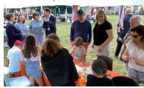
◆ Juin 2023 - Forum Éco-logique.