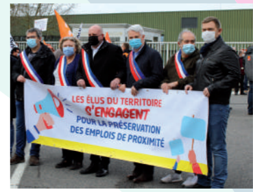
♦ Mars 2021 - Manifestation des élus devant Renault à Lardy.