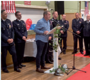
♦ Novembre 2022 - Fête de la Sainte-Barbe des pompiers.