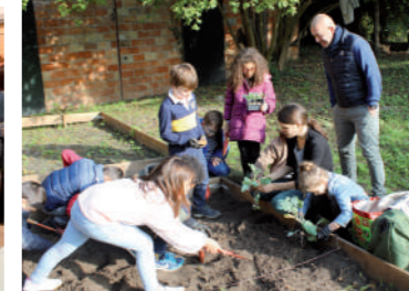
♦ Octobre 2022 - Création du jardin potager pour les écoles.