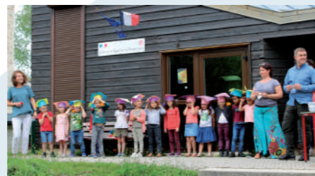
♦ Juillet 2020 - Remise des Prix aux enfants de l'école maternelle.