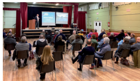
◆ Mars 2023 - 2 ème réunion publique sur le carrefour Berger.