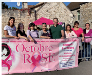
♦ Octobre 2021 - Octobre Rose.