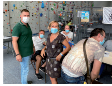
♦ Septembre 2021 - Visite au Forum des Associations à Lardy.