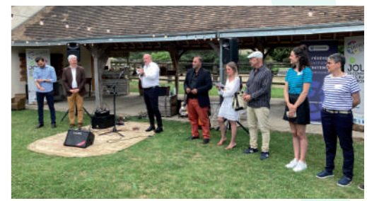
♦ Juin 2022 - CCEJR, rencontre avec les entrepreneurs locaux.