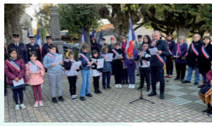
♦ Novembre 2022 - Cérémonie du 11 novembre avec les enfants du CME.