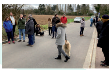
◆ Février 2023 - Réunion avec les habitants de la rue de Chagrenon à Gillevoisin.