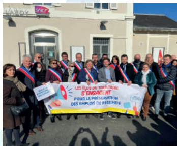
♦ Janvier 2022 - Manifestation des élus contre la fermeture de la gare de Lardy.