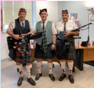
♦ Juin 2021 - 1 er comité de jumelage.