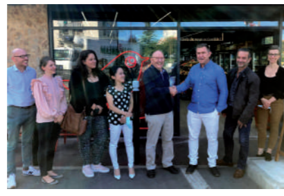
♦ Octobre 2021 - Visite et contact avec nos futurs commerçants, magasins et boulangerie.