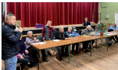
◆ Janvier 2023 - Assemblée Générale du Club Loisirs du Jeudi.