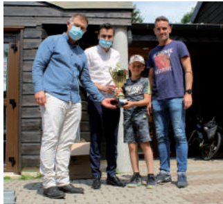
♦ Juillet 2021 - Remise du prix vélo de la CCEJR.