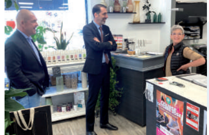
♦ Octobre 2022 - Visite aux commerçants avec le Sous-Préfet Stéphane SINAGOGA.