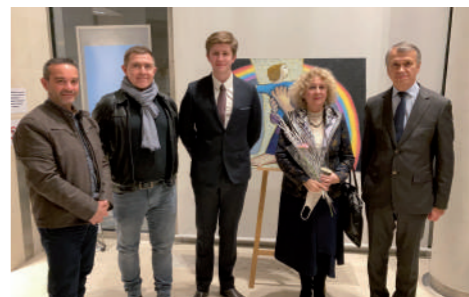
♦ Janvier 2022 - 1 er vœux du Maire en visio, avec les futurs commerçants.