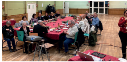
♦ Décembre 2022 - Soirée de fin d'année des élus.