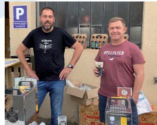
♦ Septembre 2020 - Portes ouvertes à la Brasserie de la Juine.