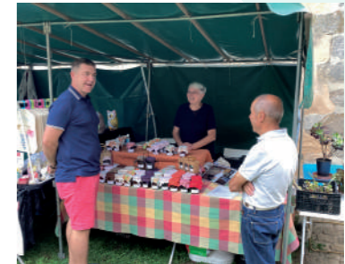
♦ Septembre 2021 - Journées du Patrimoine au château de Mesnil-Voisin.