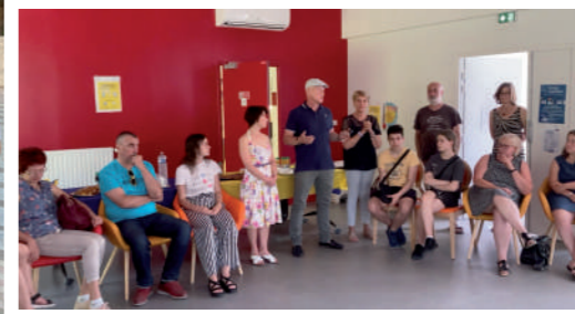
♦ Juin 2022 - Accueil des familles ukrainiennes.