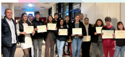
♦ Novembre 2022 - Remise des brevets du collège.