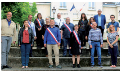
♦ Mai 2020 - Mise en place de l'équipe Agir avec les Janvillois.