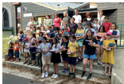
◆ Juin 2023 - Remise des prix de l'école élémentaire. ◆ Juin 2023 - Fête des voisins à Gillevoisin.