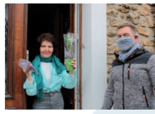
♦ Mai 2020 - Distribution du muguet.