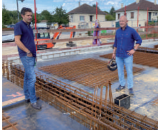
♦ Septembre 2022 - Visite de chantier.