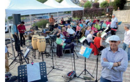
♦ Juin 2022 - 1 ère fête de la musique devant la Mairie.