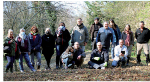
♦ Mars 2021 - Chantier citoyen au verger communal.