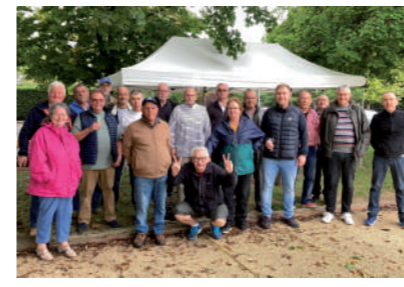
♦ Septembre 2021 - Repas avec le Club de pétanque.