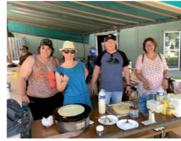
♦ Juin 2022 - Fête champêtre.