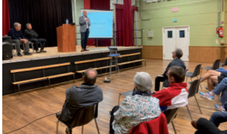
♦ Septembre 2022 - Réunion publique sur le carrefour Berger.