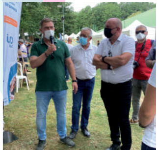
♦ Septembre 2021 - CCEJR, Bonheur Local à Boissy-sous-Saint-yon.