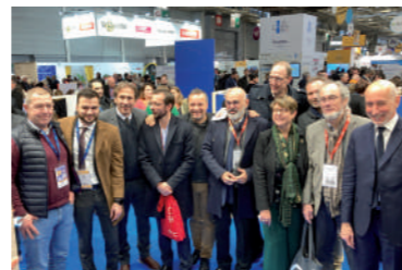
♦ Novembre 2022 - Salon des Maires à Paris.