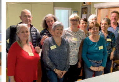
♦ Octobre 2022 - Soirée Rock du Comité des Fêtes.