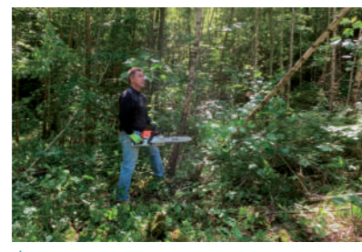
♦ Mai 2022 - 3 ème Chantier citoyen au verger communal.