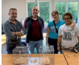
♦ Octobre 2022 - Election au Conseil de la Vie Sociale à l'IME de Gillevoisin.