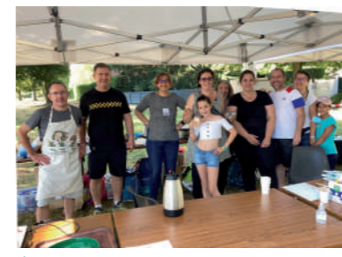
♦ Septembre 2021 - Concours de pétanque.