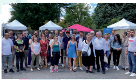
♦ Juin 2022 - Salon des "Pros de la Juine".