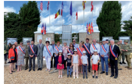
♦ Juin 2022 - Cérémonie au mémorial du cimetière américain de Villeneuve-sur-Auvers juin 2022.