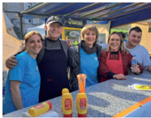
◆ Avril 2023 - Grande chasse à l'œuf au château de Gillevoisin.