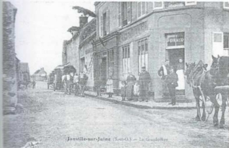
Janville-sur-Juine (S.-O.) — La Grande Rue