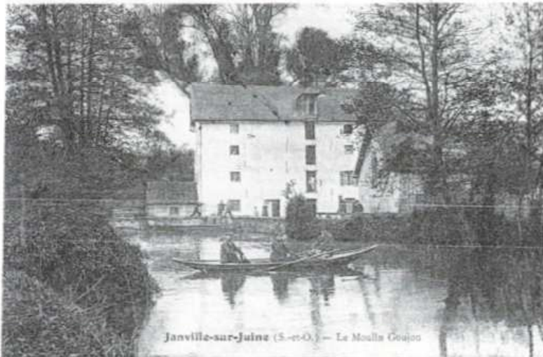
Janville-sur-Juine (S.-et-O.) — Le Moulin Goujon